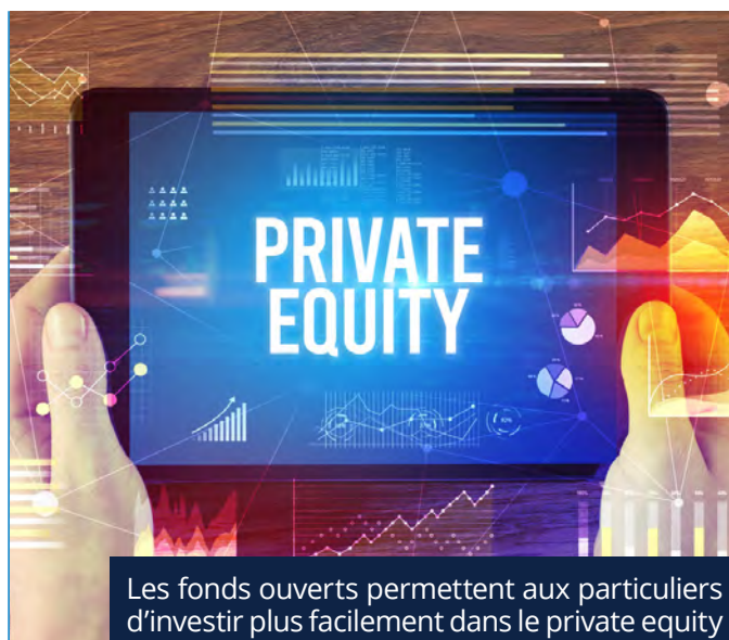
Les fonds ouverts permettent aux particuliers d'investir plus facilement dans le private equity

Mais comparer les performances entre fonds fermés et ouverts n'est pas si simple. Les premiers s'évaluent au travers d'un taux de rendement interne (TRI), tandis que les seconds affichent une performance annualisée. Les deux modes de calcul diffèrent.